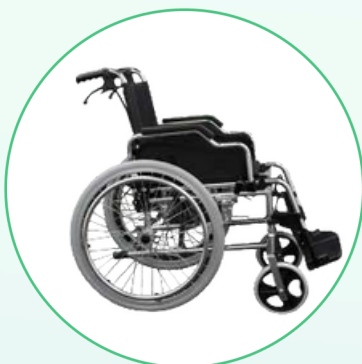
Imagen del producto